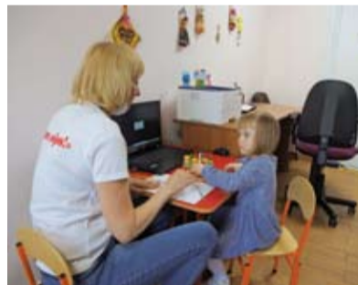
В одном из кабинетов центра.

А вот большой, с радиоприемник, аппарат, от которого тянутся провода с электродами. Это «Синхро-С» – для биоакустической коррекции. В последнее время стали актуальны безлекарственные способы лечения заболеваний центральной нервной системы. Прибор записывает у ребенка его энцефалограмму в режиме реального времени и преобразует эти импульсы мозга в звуки. Это помогает запускать процессы его восстановления, используя принцип биологической обратной связи. Инновационный аппарат стоит недешево – полмиллиона рублей. От-