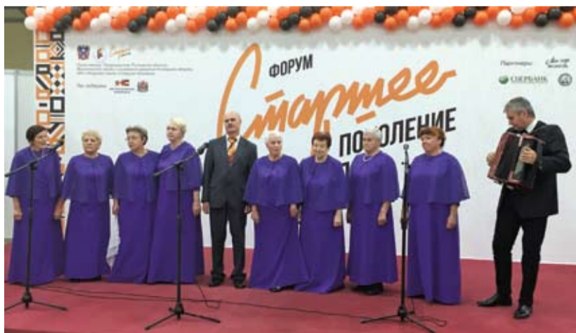
Хор «Россиянка» на форуме «Старшее поколение».